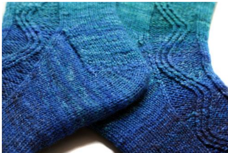
Lato esterno con gli aumenti per il Gherone

Ogni 2° giro viene lavorato 1 M1R prima dell'ultima maglia del F1 e dopo la prima maglia del F4. Tutti le maglie aumentate vengono successivamente lavorate a dir.